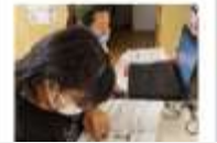
自分ができること…